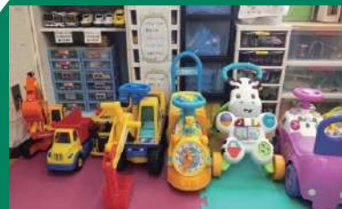
児童福祉のために