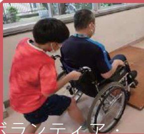
ボランティア・ 福祉教育のために