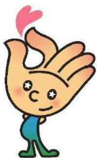
荒川社協キャラクター ひらりちゃん