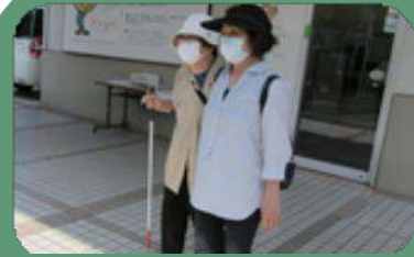
障がい者福祉のために