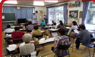
地域福祉のために