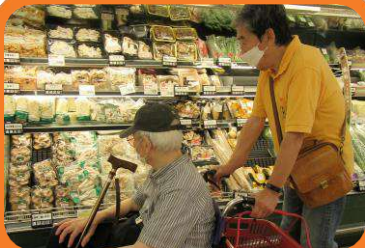
高齢者福祉のために