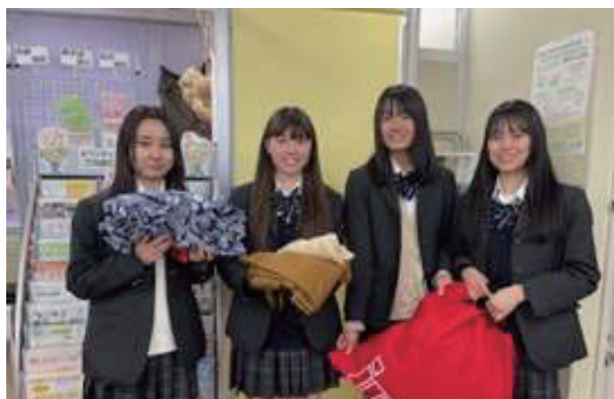
↑たくさんの着物、大切に使用させていただきます