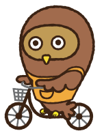
東京都福祉人材センターキャラクター フクシロウ