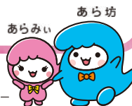
荒川区シンボルキャラクター