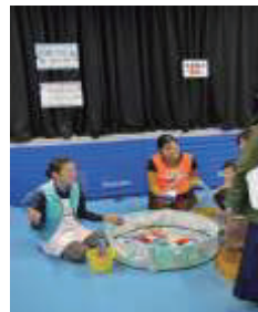
わくわくフェスタ