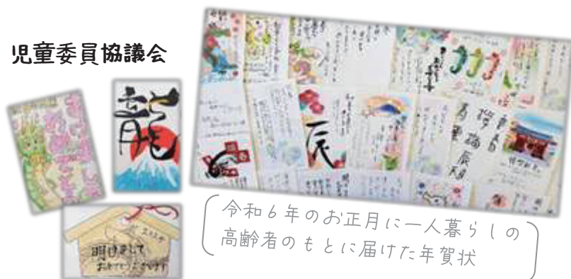
令和6年のお正月に一人暮らしの高齢者のもとに届けた年賀状