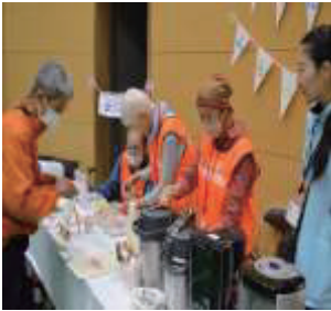
ふらっとフラット