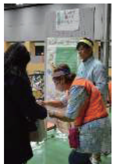
粹・活クイズラリー